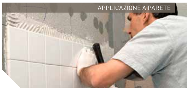
APPLICAZIONE A PARETE

ISOLCOLL A30 SUPER si applica sul sottofondo mediante spatola dentata. È estremamente importante scegliere l'altezza del dente. Consigliamo un'applicazione in due mani successive. Una prima mano dal lato liscio della spatola e successivamente una mano con il lato dentato della spatola. Nel caso di piastrelle di grandi dimensioni, pavimenti da levigare e carichi gravosi in genere, per una maggiore sicurezza nell'applicazione consigliamo di spalmare il materiale anche sul retro della piastrella. È importante controllare che la colla ancora fresca non abbia formato una pellicola superficiale tale da impedire la bagnatura della piastrella. In tal caso, rinvenire il supporto ristendendolo con la spatola dentata. Il tempo con cui si forma questa pellicola varia molto e dipende dal grado di assorbimento del supporto, da vento, sole diretto, temperatura.